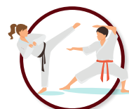
Encuentro Artes Marciales