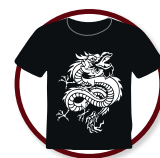
Puestos de Merchandising